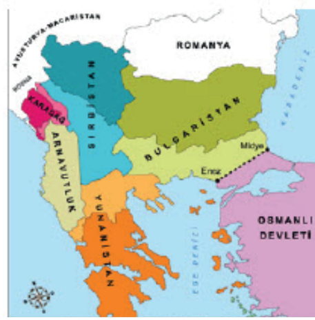
I. Balkan Savaşı sonrasında Balkanlar

Bu haritalara göre aşağıdakilerden hangisine ulaşamaz?