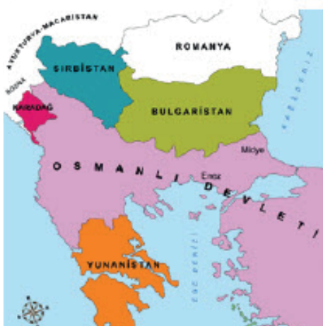
I. Balkan Savaşı öncesinde Balkanlar